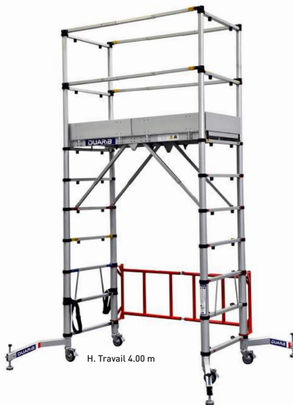
H. Travail 4.00 m